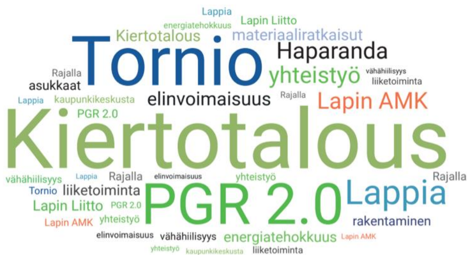
Kuva 1. Hanketta ja kaupunkikiertotaloutta kuvaava sanapilvi.

Kiertotalouden periaatteiden mukaisilla kehitystoimenpiteillä on mahdollisuus luoda kaupunkialueille uutta toimintaa kestävästä kehitystä ja vähähiilisyttä edistäen. Megatrendiksi noussut kiertotalous tarjoaa uusia liiketoimintamahdollisuuksia sekä tapoja kehittää olemassa olevia toimintoja tai alueita kestävämpään suuntaan. Kaupunkikeskuksia- ja yhdyskuntarakenteita kehitettäessä kiertotalous ja sen toteuttaminen eri toimialoilla voi tarjota uudenlaisia yhteistyömahdollisuuksia sekä merkittävää uutuus- ja lisäarvoa kaupunkikeskusten kehitykseen. Tämä kuitenkin vaatii selkeitä, konkreettisia ja kullekin kehitysalueelle soveltuvia toimenpiteitä tai kehitysesimerkkejä. Positiivisena vaikuttimena on kaupunkialueiden houkuttelevuuden lisääminen yrittäjien keskuudessa, mikä taas edes auttaa elinvoimaisten kaupunkialueiden ylläpitoa ja kasvattamista. Kuvaan 1 on koottu sanapilven muotoon hankkeeseen ja kaupunkikiertotalouteen liittyviä teemoja.