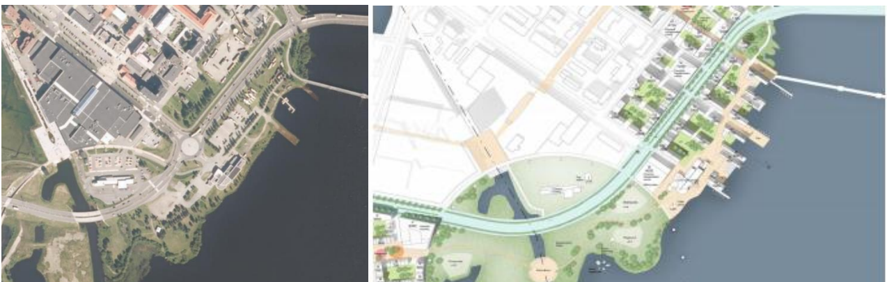
Kuva 2. Tornion Suensaaren-alueen ilmakuva nykytilassaan (vas.) sekä havainnekuva alueesta visioiden toteutumisen jälkeen (oik.).

Kuvassa 2 on esitetty havainnekuva alueesta nykytilassaan (vas.) sekä havainnekuva Suomen ja Ruotsin rajan molemmin puolin mahdollisten uusien visioiden toteutumisen jälkeen (oik.). Alueella sijaitsee nykyisin vain yksi liiketila rannan tuntumassa mutta vilkkaasti liikennöidyn tien toisella puolella on tehty jatkuvaa kehitystyötä niin liiketilojen kuin myös asuinrakennusten uudistamisen parissa. Alueella on kasvavissa määrin myös matkailuliikennettä Ruotsin puolelle. Alueen suunnittelussa ja kehittämisessä halutaan huomioida kiertotalouden tarjoamat mahdollisuudet niin rakentamisen, ympäristörakenteiden, liikeneratkaisujen, asumisen, liiketoiminnan ja palveluiden osalta. Alueen toteuttamisessa huomioidaan myös alueellisten ja paikallisten toimijoiden näkemykset ja visiot, jotta alueelle muodostuisi elävän kaupunkikeskuksen ohella myös kiertotaloustoimintojen ja -osaamisen keskittymä.