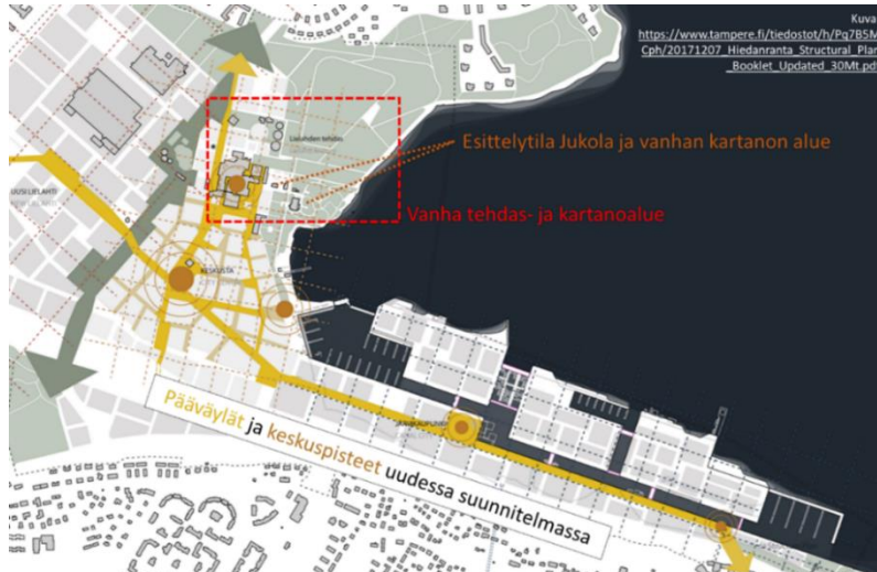
Kuva 4. Yleiskuva alueesta ja sinne suunnitelluista uusista alueista (Keskusta, Järvikaupunki ja Uusi Lielähti) sekä alueita yhdistävä pääväylä, jolle sijoittuu myös tulevaisuudessa raitiovaunuliikennöinti.