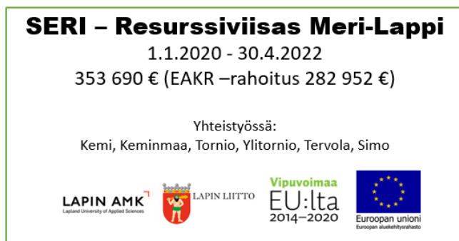
Kuva 1. Hanketiedot SERI – Resurssiviisas Meri - Lappi

SERI – Resurssiviisas Meri-Lappi -hankkeessa (Kuva 1) selvitettiin HINKU-statuksen saannin edellytykset kunnalle. Tavoitteena oli selvittää, millaisilla toimilla Meri-Lapin kunnat pääsisivät mukaan HINKU-verkostoon ja mitkä toimenpiteet olisivat tehokkaimpia ilmastotavoitteiden täyttämiseksi. Selvityksen taustana käytettiin Suomen ympäristökeskuksen ja Canemure-hankkeen tuottamaa perustietoa HINKU-verkostosta sekä lisäksi vertailtiin eri kuntien tekemiä toimia ilmastotyössään. Näistä koottiin tärkeimpiä ja tehokkaimpia asioita yhdeksi paketiksi hiilineutraaliustavoitteiden saavuttamiseen kuntasektorilla.