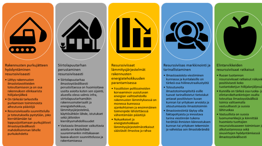
Kuva 4. Resurssiviisaat toimenpiteet avuksi HINKU-työhön.

Resurssiviisailla toimenpiteillä voidaan toteuttaa eri aloilla kasvihuonepäästöjä vähentäviä toimia. SERI – Resurssiviisas Meri-Lappi -hankkeessa toteutettiin resurssiviisautta edistäviä selvityksiä, joista löytyy myös yhteys hiilineutraaliustyöhön, jota kunnissa ja yrityksissä tehdään (Kuva 4).