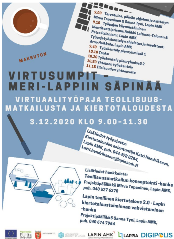
Kuva 3. Virtusumpit työpajan kutsu ja ohjelma