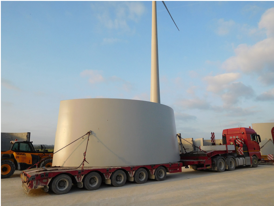
Kuva 4 Tuulivoimalan tornilohkon osa (Wikimedia Commons 2018)