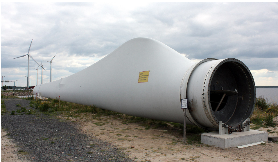
Kuva 6 Tuulivoimalan lapa (Wikimedia Commons 2011)

Tuulivoimalan lavat (Kuva 6) valmistetaan komposiittimateriaaleista. Lavat ovat yhdistelmä lasikuitua, hiilikuitua, balsapuuta, metallia sekä kertamuoveja, epoksia ja polyesteriä, jotta ne kestävät niihin kohdistuvaa kuormitusta. (Paalatie 2020.) Suomessa pisimmät käytössä olevat lavat ovat noin 75 m pitkiä ja painoa niillä on yli 10 000 kg. Lapojen asentoa säätämällä ne toimivat myös tuulivoimalan tehonsäätö- ja pysäytysmekanismina. (Suomen Tuulivoimayhdistys 2021d.) Lapojen muotoilu on tarkkaan harkittu ja optimoitu. Lavat ovat taipuisia ja rakenteeltaan kerroksittaisia, jotta ne kestävät niihin kohdistuvan tuulen voiman. Tuulivoimalan siivessä voi olla lisäksi lämmityselementti estämässä lapojen jäätymistä arktisissa olosuhteissa. (Paalatie 2019b.)