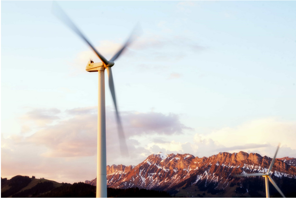
Kuva 2 Vaaka-akselinen tuulivoimala

Vaaka-akselituulivoimalan päätyypit ovat etutuuli- ja takatuulivoimalat. Nykyään käytetään yleensä etutuulivoimaloita, joissa roottori on tornin suhteen tuulen etupuolella. Takatuulivoimalat olivat ennen melko yleisiä. Niissä roottori sijaitsee torniin nähden tuulen alapuolella. Takatuulivoimaloiden etuna on, että suuntauskoneisto voidaan jättää pois, sillä lavat kääntävät voimalan tuuliviirin tavoin oikeaan suuntaan. Ongelmana kuitenkin on tornin taakse syntyvät pyörteet sekä melu ja värinä. (Suomen Tuulivoimayhdistys 2021e.)