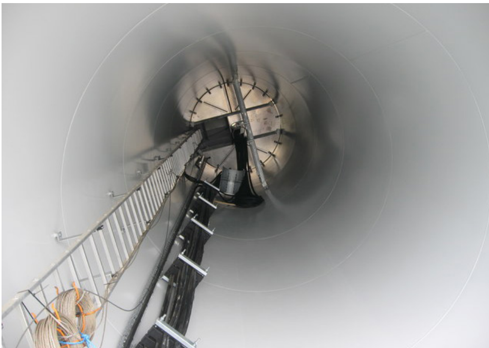
Kuva 5 Tuulivoimalan runko sisältä