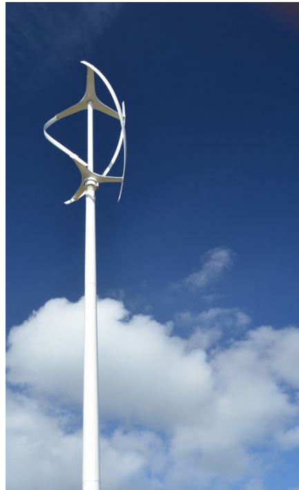
Kuva 3 Pystyakselinen tuulivoimala (Ashley Dace 2012)

Tekniikka & Talous lehti uutisoi lokakuussa 2021 Pohjanmerelle rakennettavasta maailman suurimmasta kelluvasta tuulivoimapuistosta. Hywind Tampen -tuulivoimapuisto on tavoitteena ottaa käyttöön syksyllä 2022 ja se tulee koostumaan 11:stä kahdeksan MW:n voimalasta. Tuulivoimapuisto tulee tuottamaan sähköä