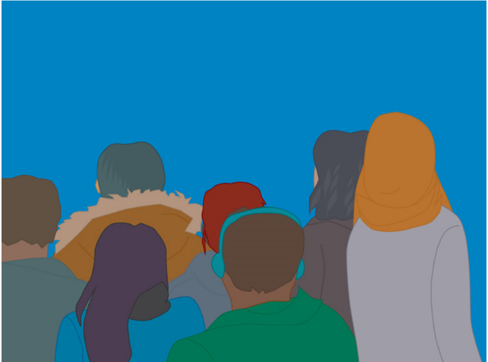
Kuva 2. Hankkeeseen tuotettua grafiikkaa

Ohjausmalliin (kuva 1) on koottu hankkeen aikana hyväksi havaitut ohjauksen käytänteet maahanmuuttajien näkökulmasta. Nuolessa olevat laatikot kuvaavat kouluspolkua ja sen aikaisia askelmia aina opiskelijarekrytoinnista ja yksilöllisten koulutuspolkujen suunnittelusta kohti tutkinto-opintoja ja työllistymistä. Askelmista on nostettu keskeisiä sisältöjä kuvion reunoille. Avoimet korkeakouluopinnot ja avoimen korkeakoulujen saavutettavat TNO-palvelut kulkevat askelmilla mukana avoimen korkeakoulun opiskelijaksi hakeutumisesta tutkinto-opintoihin siirtymiseen saakka.