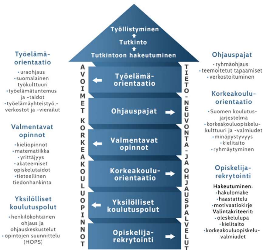
Kuva 1. Hankkeessa tuotettu ohjausmalli