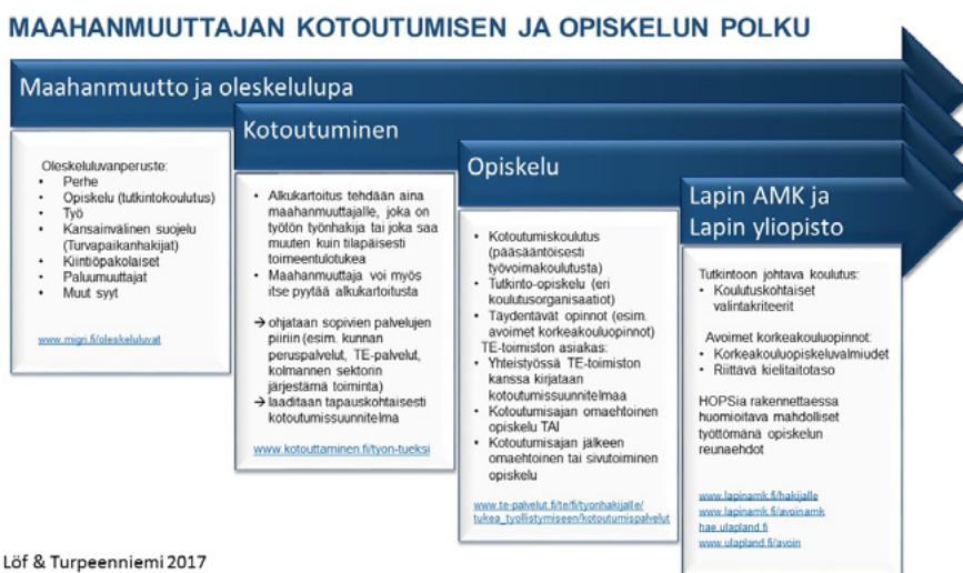
Kuva 3. Maahanmuuttajan kotoutumisen ja opiskelun polku

Lapin ammattikorkeakoulu ja Lapin yliopisto toteuttavat yhteistyössä Tie tutkintoon -hankkeen lisäksi myös toista, eri kohderyhmälle suunnattua, maahanmuuttajien kouluttautumisen, osaamisen kehittämisen ja TNO-palveluiden kehittämisen hanketta; Step2job – korkeakouluetut maahanmuuttajat työuralle (Lapin yliopisto 2017b). Molemmissa hankkeissa tavoitteena on edistää maahanmuuttajien tasavertaista asemaa suhteessa kotimaan väestöön tukemalla maahanmuuttajien kotoutumista ja osallistumista sekä koulutukseen että työelämään. Molempien hankkeiden aikana on kertynyt paljon kokemuksia, tietämystä ja osaamista hankkeiden omien tavoitteiden ja toimenpiteiden kautta. Kerrytettyä osaamista hyödynnettiin yhteistyönä tehdyssä maahanmuuttajan kotoutumisen ja opiskelun polku-kuvauksessa (Kuva 3).